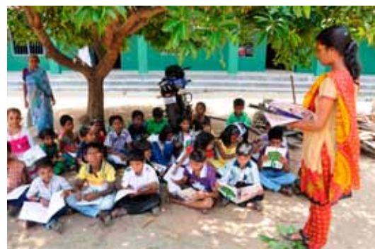
Sommercampen har været en succes for børnene, der her lytter opmærksomt til deres lærer.

Derfor vil det betyde uendelig meget for børnene, hvis de får en fadder, så deres skolegang bliver sikret.