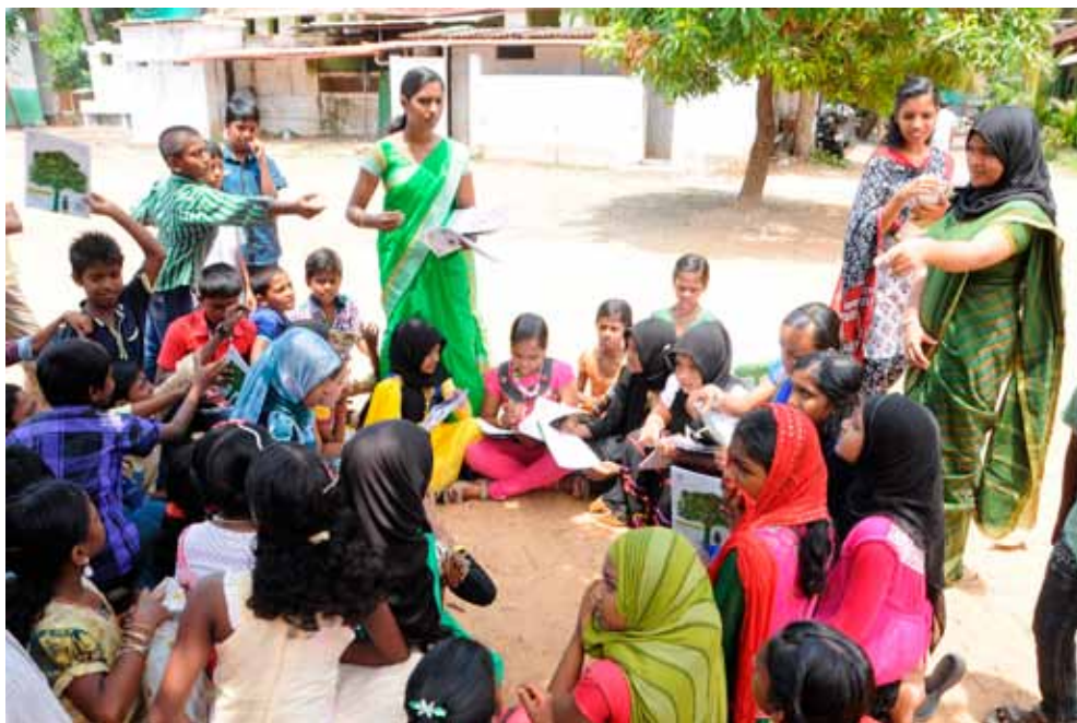
Børnene i tsunami-projektet har fået lejlighed til at komme på en sommercamp, og det har været meget stimulerende for dem.