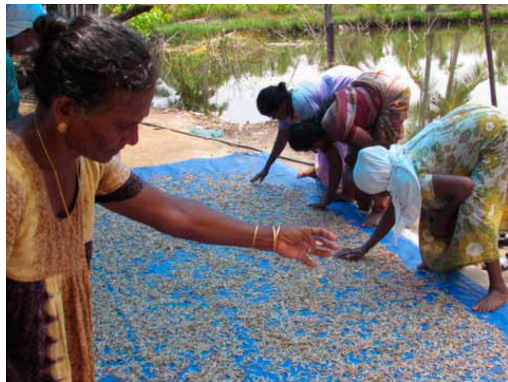
Kvinderne sorterer tørret fisk ude i det fri i projektet.

Der tændes lys ved indvielsen af iværksætterstøtteprojekterne, og det betyder, at man ønsker, det skal bringe lykke og held. Det er nogle ritualer, som de gennemfører i Indien ved indvielser og ved besøg på projekter, hvor man skal være med til at tænde lyset